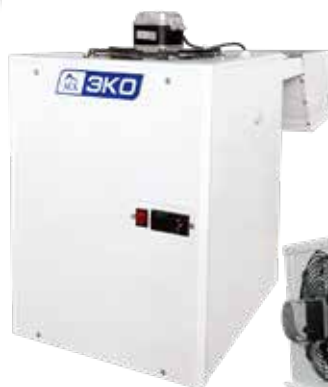
Эконом-серия АСК ЭКО