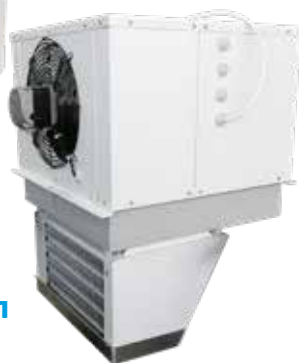
Напольно-потолочная серия АСК-п