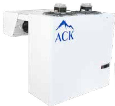
Стандартная серия АСК

Моноблок устанавливается на холодильную камеру из теплоизоляционных сэндвич-панелей толщиной не более 150 мм. При установке на холодильную камеру, выполненную из сэндвич-панелей толщиной 80 мм, рекомендуется под компрессорно-конденсаторный блок тяжелых моноблоков (4 и 5 габарита) устанавливать подставку.